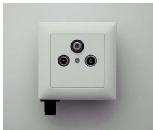
Bild 2 Netzabschlussdose als WÜP

Beim Endteilnehmer wurden die anliegenden optischen Signale wieder in eine für den Fernseher