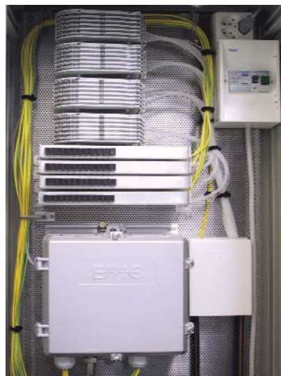
Fibre Node Hub

Télédistal entschied sich für die Glasfaserlösung von EMC als beste Infrastrukturlösung überhaupt.