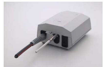
Home Termination Unit

Als Glasfaserkabel durch die Leitungen gezogen wurden, lieferte EMC das aktive und passive Equipment. Die Installation des Systems sowie der Anschluss der ersten Haushalte erfolgten im März 2005. Anfang April waren die Kunden mit CATV- und Internetdiensten versorgt.