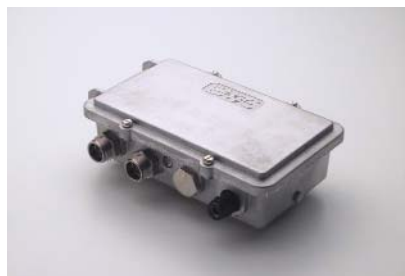
Optical Extender, 4 ports

Extender in Ihr Netzwerk einsetzen, können Sie Ihr HFC-Netzwerk bis hin zu abgelegenen Haushalten ausbauen.