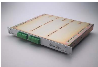
Mehrfach-Rückweg-Empfänger, 32 Ports

RXR ist für die Verarbeitung unterschiedlicher optischer Eingangsspiegel ausgelegt. Das System zeichnet sich durch eine unerhebliche Verschlechterung der Signalqualität (S/N) auf den Rückkanälen aus.