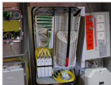
Fiber Management Box "Outdoor" Model Family: NHF-4004