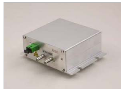
Mini Node FTTx "Residential" Model Family: NHP-3400